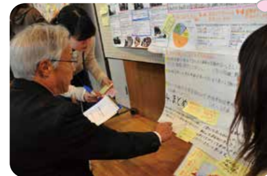
↑昨年度「地域エンパワねっとI」報告会の様子

※資料等の準備の都合上、事前にお申し込みいただければ幸いです。なお、当日参加も可能です。