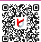
社会共生実習 Webサイト