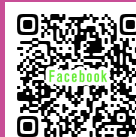
坂本プロジェクト外+α Facebook