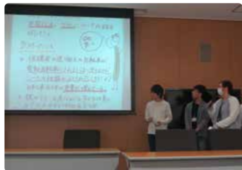
↑授業で学生たちが発表する様子

龍谷大学「大津エンパワねっと」は、学生と地域が協働してまちづくりに取り組むプログラムです。今回は、2015年4月より活動しているエンパワねっと8期生が地域の皆さんと1年かけて取り組んできた成果を報告いたします。地域の皆さんとともに「課題発見→解決→共有」してきた内容を再確認し、「学生力」と「地域力」を相互に高めあいながら地域社会がより元気になるための土壌づくりができればと願っております。たくさんのご参加をお待ちしております。