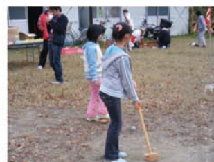
グランド ゴルフの 様子

私たちは地域と世代の枠を越えた地域間交流という目的で中央学区子ども育成連絡協議会さんと体育振興会さんにお世話になっています。最近行った活動として、体育振興会さん主催のグランドゴルフに参加しました。初めて地域の活動に参加して、地域に関わる一員としての自覚や責任を持って実習に取り組みたいと思いました。今後の活動としては12月6日にあるさよならの集いです。